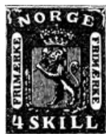
Løvefrimerket fra 1863.

På den neste norske frimerketypen som kom i 1867, er riksvåpenet nokså likt 1863-utgaven, men det varierer i detaljer. Den spenstige løven fra 1863 er byttet ut med en slappere løve - mer lik den i 1855.