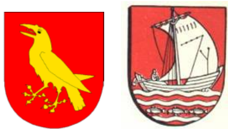
Byvåpnene til Moss og Ålesund

De kommunale våpen forekom ikke på norske frimerker. Men den 27. mai 1986 tok man et krafttak og utga frimerker som hvert hadde fem kommunevåpen og ikke bare norske. Nordiske vennskapsbyer ble symbolisert på frimerkene med sine våpen i farger og med henholdsvis Moss og Ålesund sentralt plassert.